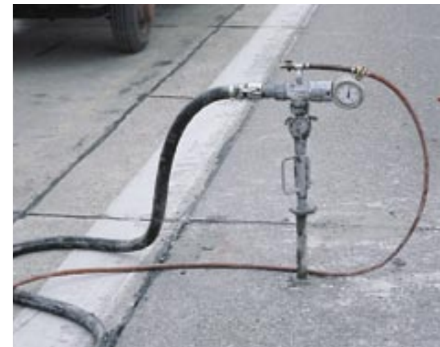
Aquí se inyecta con la P 13 una suspensión de cemento debajo de losas de una calzada.