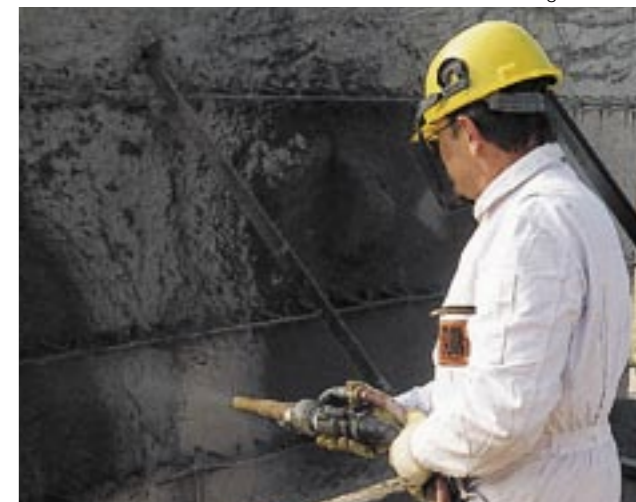
El hormigón proyectado grueso (en este caso de 8 mm) solamente puede procesarse mediante una bomba de émbolo como la P 13.