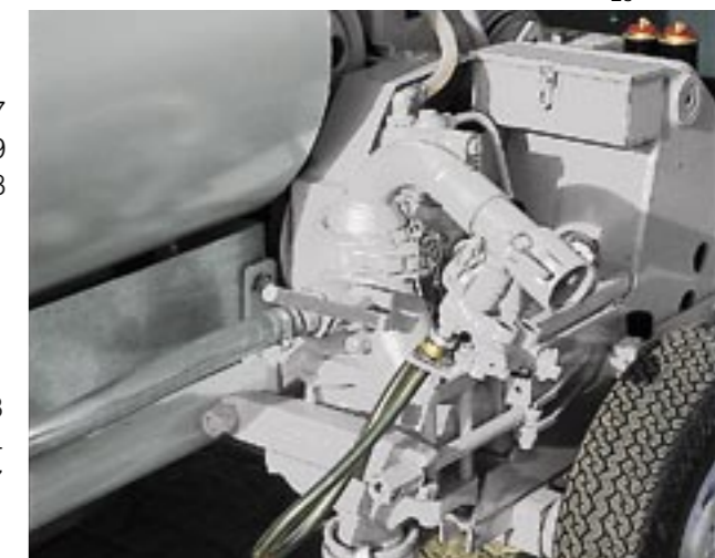
La bomba de doble émbolo (en la figura la KK 139 con hasta 120 l/ min. de rendimiento de bombeo) asegura