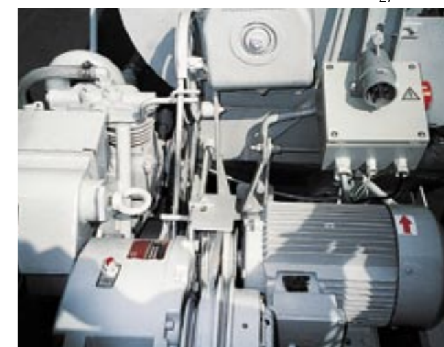
El potente motor eléctrico de 400 V rinde 7,5 kW, la versión „S“ incluso 11 kW.