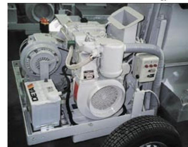
El motor diesel bicilíndrico es sumamente resistente y pobre en mantenimiento. Rinde 12,5 kW.