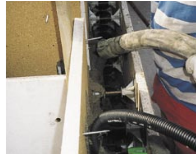
Junto a trabajos estándar como enlucidos base o enlucidos proyectados, la P 13 es también idónea para obras en las que han de transportarse grandes volúmenes como,